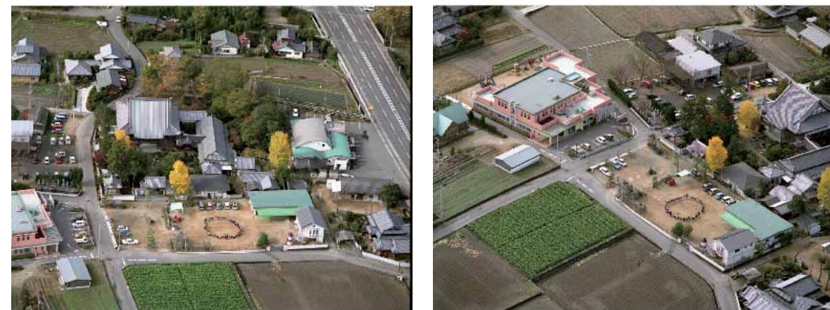
昨年秋、徳勝寺周辺を航空撮影した写真です。撮影費用の一部は維持費会計雑費からも出ております。